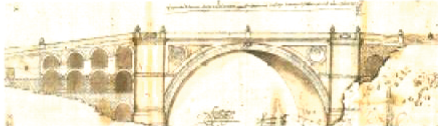
Trazo para la construcción de un puente en Bazta (1574). Tinta sobre papel. De Andrés de Vandelvira y Francisco del Castillo el Mayor